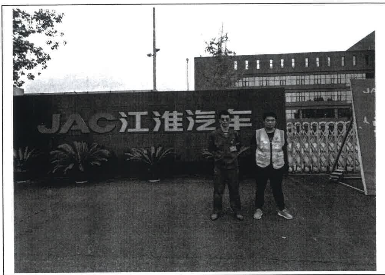
现场监测人员与企业陪同人员留影